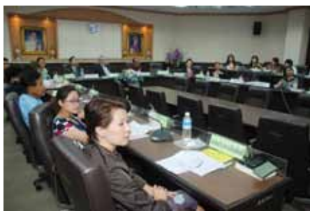
ประชุมคณะกรรมการภาคประชาชน ครั้งที่ ๑/๒๕๕๕ วันที่ ๑ กุมภาพันธ์ ๒๕๕๕