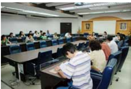
ประชุมคณะกรรมการของ อย. และ ผู้มีส่วนได้ ส่วนเสีย วันที่ ๙ มกราคม ๒๕๕๕