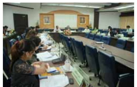
ประชุมคณะกรรมการภาคประชาชน ครั้งที่ ๒/๒๕๕๕ วันที่ ๕ มีนาคม ๒๕๕๕

ก ิจกรรมส่งเสริมการมีส่วนร่วมของประชาชนได้ก้าวเข้าสู่ปีที่ ๖ แล้วค่ะ โดยที่ผ่านมากิจกรรมการมีส่วนร่วมของประชาชนในการดำเนินงานของ อย. สามารถดำเนินการได้ครบถ้วนบรรลุตามวัตถุประสงค์ เป้าหมายที่กำหนดไว้ และในปีงบประมาณ พ.ศ. ๒๕๕๕ อย. ยังคงให้ความสำคัญในการส่งเสริมความรู้ ความเข้าใจในการบริโภคผลิตภัณฑ์สุขภาพแก่ประชาชนให้สามารถพึ่งพาตนเองได้ และบริโภคอย่างปลอดภัย สมประโยชน์ เพื่อสุขภาพที่ดี โดยเน้นการให้ความรู้เกี่ยวกับอันตรายจากน้ำมันทอดซ้ำ